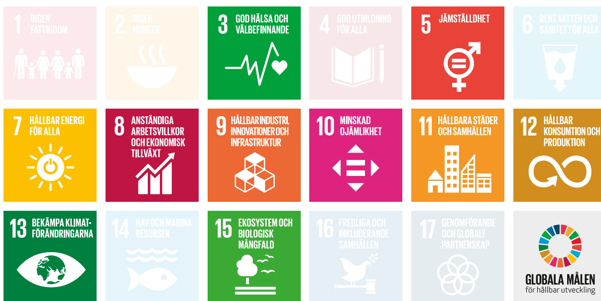
FN:s mål för hållbar utveckling

” Genom att producera lokalt kan vi minska miljöpåverkan från transporter. Vi prioriterar leverantörer i vårt närområde.